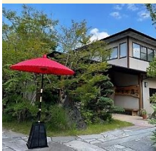
2021年 リニューアル客室 (由布岳ビューツイン)

1985年に民宿としてスタートし、40年近くの歴史を持つ「旅想 ゆふいん やまだ屋」が、2021年7月に大浴場と一部客室の改装工事を終え、待望のリニューアルオープンを迎えました。創業当時から大切にしている木のぬくもりをしっかりと残しつつ、和モダンを取り入れたスタイリッシュな大浴場や、近年ご希望の多かったベッド付客室も新たに加わりました。長閑な田園風景に囲まれながらも、由布院駅やメインストリートの湯の坪街道までは徒歩圏内。観光の拠点として、趣向を凝らしたお料理とともに、上質な癒しのひとときをお過ごしください。