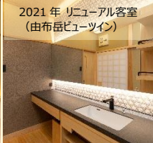
2021年 リニューアル客室 (由布岳ビューツイン)