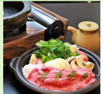
夕食 (イメージ) 時期によりメニューが異なります。